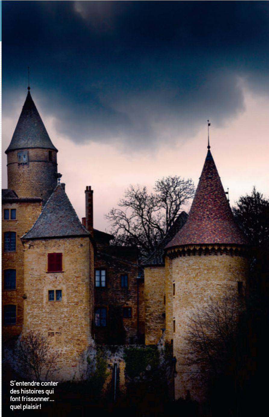
S'entendre conter des histoires qui font frissonner... quel plaisir!

Le Petit Théâtre , 12, place de la Cathédrale, Lausanne. Plus d'infos au 021 323 62 13, www.lepetittheatre.ch et www.ciegaspard.ch